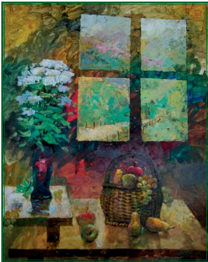
Ставре Димитров – Стадим, „мртва природа“, 80 см на 100 см, масло на платно Stavre Dimitrov – Stadim « Nature morte », 80 cm x 100 cm, huile sur toile