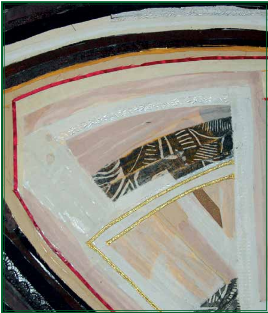
Маријана Костојчиноска, 40 см на 60 см, колаж Marijana Kostojcinoska, 40 cm x 60 cm, collage