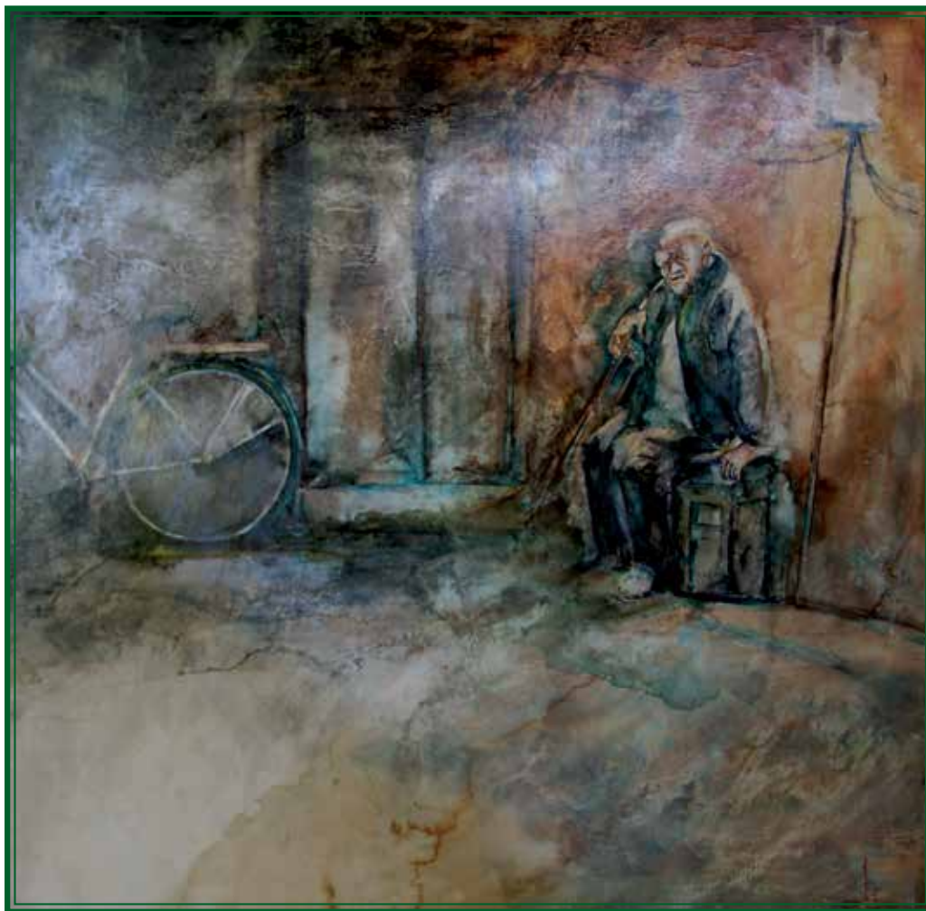
Хо-Ми-Ан, Франција, 100 см на 100 см, акрил на платно Ho My An, France, 100 cm x 100 cm, acrylique sur toile