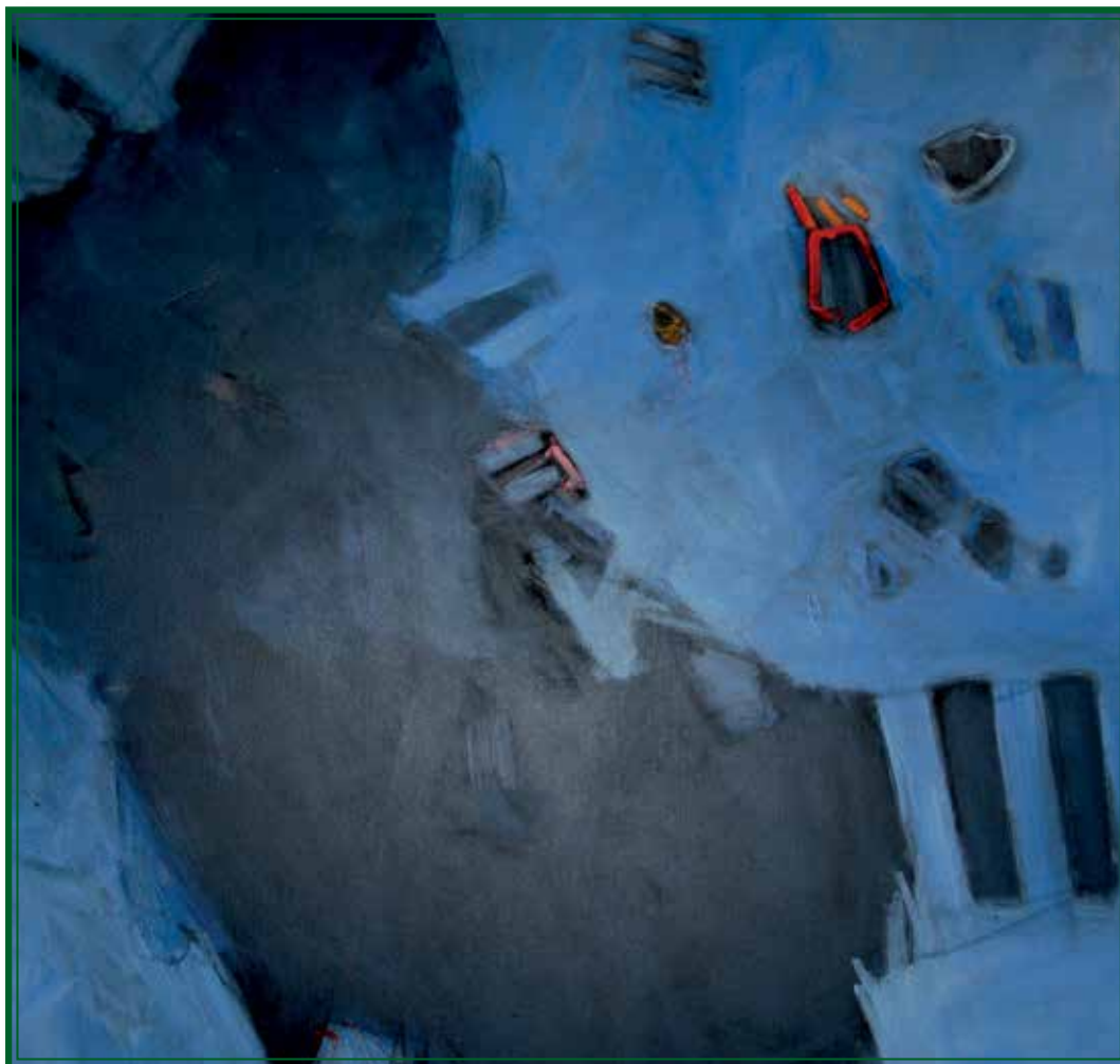
Атанасиос Карамитас, Грција, 100 cm на 100 cm, акрил на платно Atanasios Karamitas, Grèce, 100 cm x 100 cm, acrylique sur toile